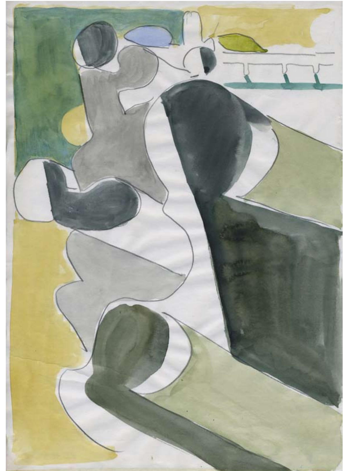
SKICA —PODBOČJE I., OK. 1970 AKVAREL, OLOVKA / AKVAREL, SVINČNIK 297 X 210 MM