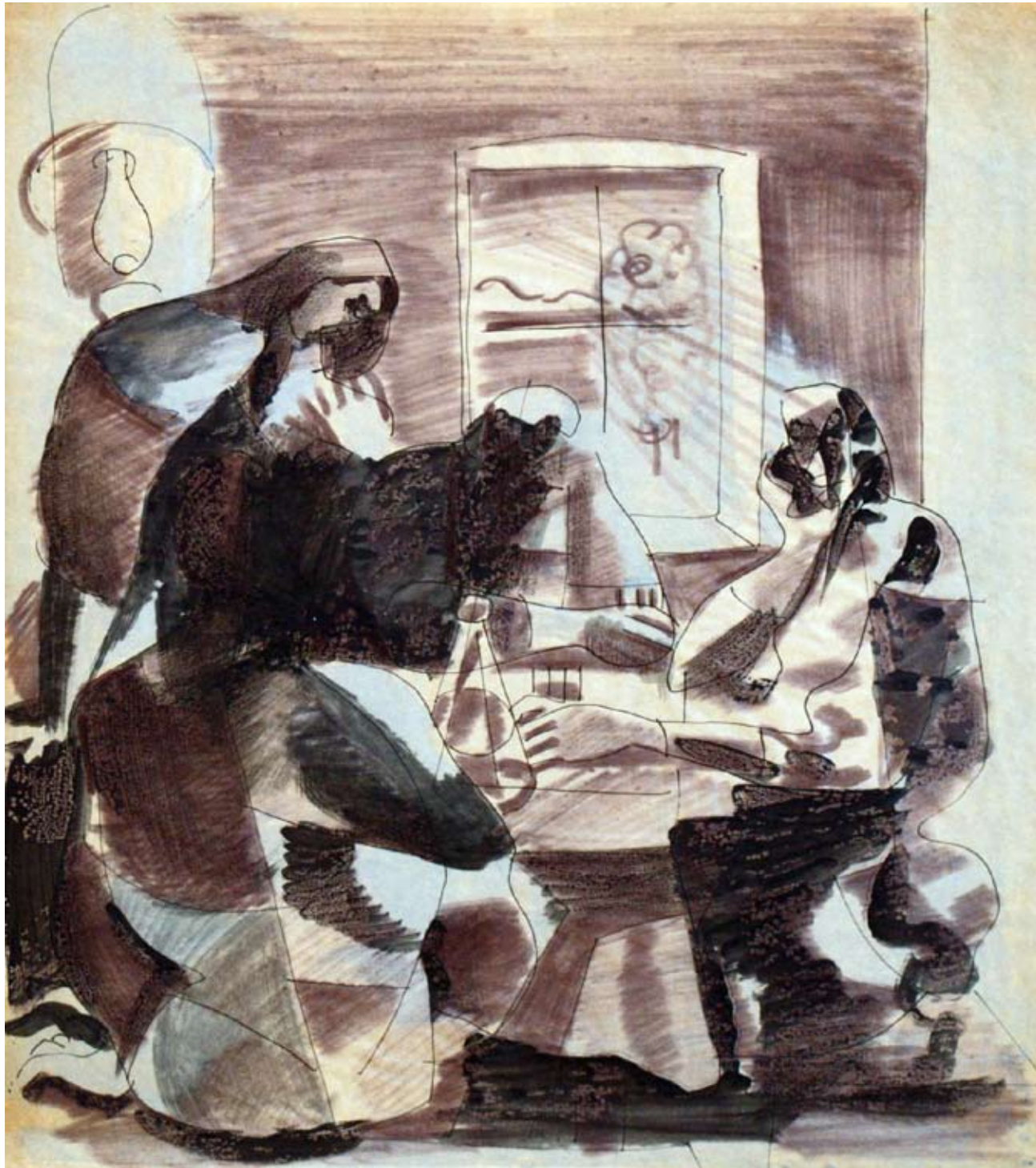
STUDIJA DAĀE / ŠTUDIJA SEDMINE TUŠ, FLOMASTER, AKVAREL / TUŠ, FLOMASTER, AKVAREL 475 X 420 MM